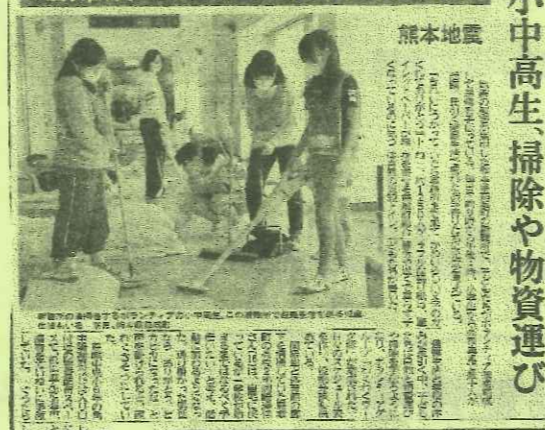
岐阜新聞(夕刊) 4月28日(木)

新聞でも取り上げられているよう、熊本地震の被害があった各地の避難所で、子どもたちがボランティア隊を結成して運営を手伝い、大活躍しました。 自宅が損壊し、自らも避難所で暮らしている生徒も少なくないですが、物資の運搬や避難者への食事の配膳などに奔走。「生まれ育ったまちのため」と若者が汗を流す姿は、被災者や長引く避難生活で疲れたお年寄りの達に勇気や元気を与えました。