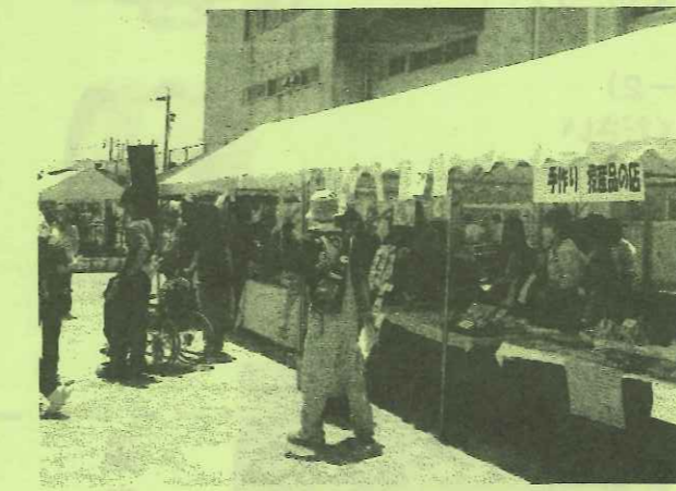
↑利用者さん、職員さん、ボランティアさんが一緒にいる模擬店はとってもにぎやか!

ボラセンに申し込みいただいて、このボランティアに初めて参加した方は、「暑かったけど、とても楽しかった。主催者からお礼の手紙が届きうれしかった。また来年も参加したい。」とおっしゃっていました。ボラセン職員もボランティアとして参加し、ボランティアさんや職員の方とも交流でき、とても楽しく活動ができました。来年のいぶきふれあいまつりも楽しみです!