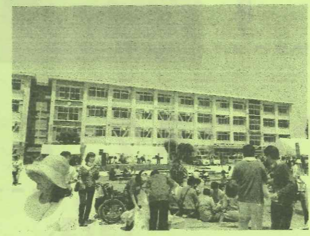
↑雲ひとつない晴天、絶好のまつり日和です!

平成28年5月21日(土)、朝から照りつける強い日差しの中、島小学校にて、25回目となる社会福祉法人いぶき福祉会主催の「いぶきふれあいまつり」が開催されました。毎年沢山のボランティアさんが参加するいぶきまつりですが、今年も学生さんを始め大勢の方がボランティアとして参加され、模擬店・利用者さんの付き添い・清掃活動・駐車場整理等のお手伝いをしていました!